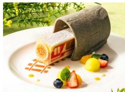
特別デザートプレート（ランチ時提供）