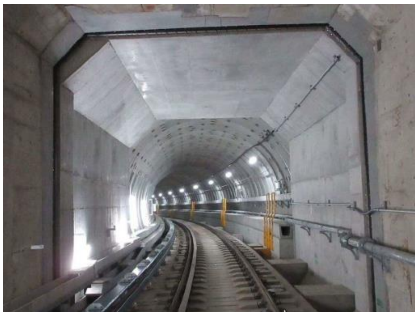
トンネル接続部へは、終電後の線路を歩いて向かいます。

北大阪急行電鉄は1970年に開催された大阪万博会場への鉄道輸送手段として、同年2月24日に開業しました。それから55年の歳月を経て、本年4月には「EXP02025 大阪・関西万博」が開催されます。55年前に造られたトンネルと、延伸により新しく造られたトンネルとの接続部を歩きながら、大阪で開催されたこの二つの「万博」にも思いを馳せていただきたいと思います。