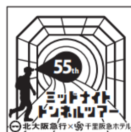
ツアーオリジナルロゴ（上） ロゴ入りステンレスボトル（左）