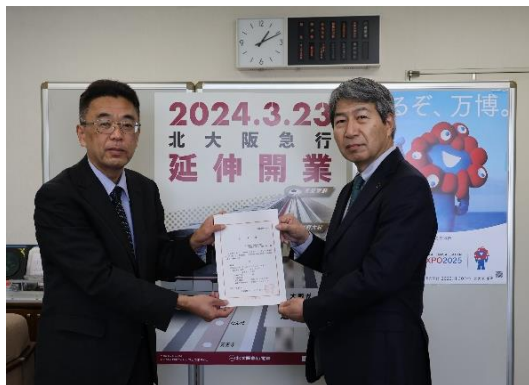
近畿運輸局 道久 聡 鉄道部長より 鉄道事業法区間の合格書の交付を受けました（3月14日）

本延伸事業の着手からこれまでの期間、国土交通省や大阪府などの関係機関をはじめ、沿線住民の皆さまや工事関係者の皆さまには多大なるご理解とご協力をいただきました。当社では、この開業をきっかけに、公共交通機関として安全安心で快適な輸送サービスの提供を通じて、北摂エリア全体の活性化に貢献できるよう、より一層努めてまいります。