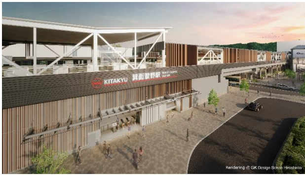
東側 構外駅名看板