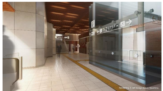
南改札 案内サイン