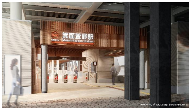
北改札 構外駅名看板