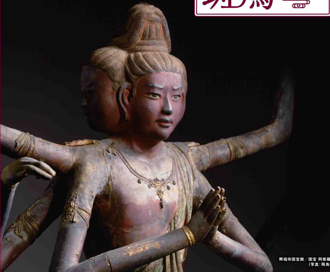
興福寺国宝館 / 国宝 阿修羅像