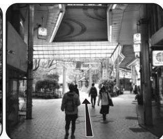
アーケードを抜けたこの先が原田神社