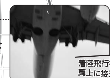
着陸飛行機が真上に接近!!