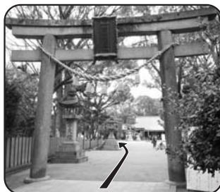
原田神社 石鳥居は1688年に造られた有形文化財です(本殿の境内左手がルートです)